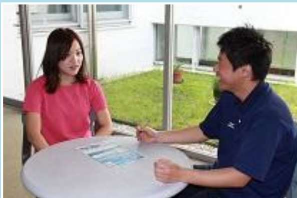
運動メニューの見直し