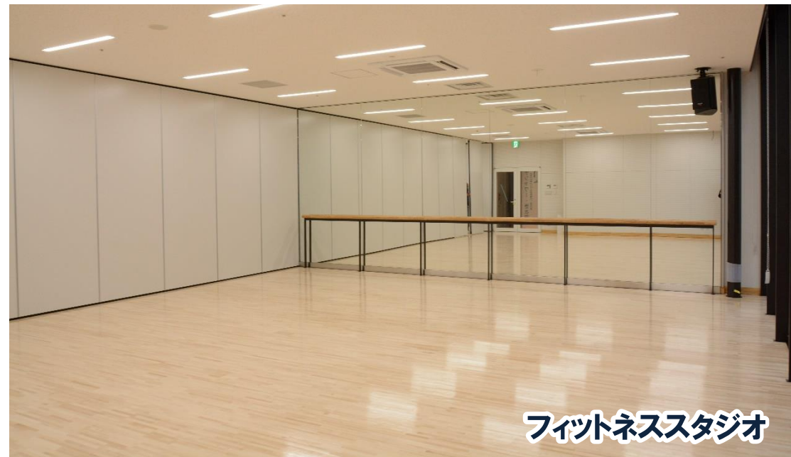
フィットネススタジオ